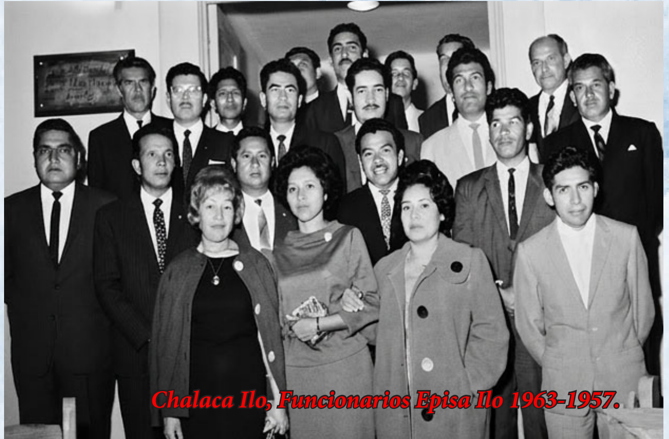
Chalaca Ilo, Funcionarios Episa Ilo 1963-1957.